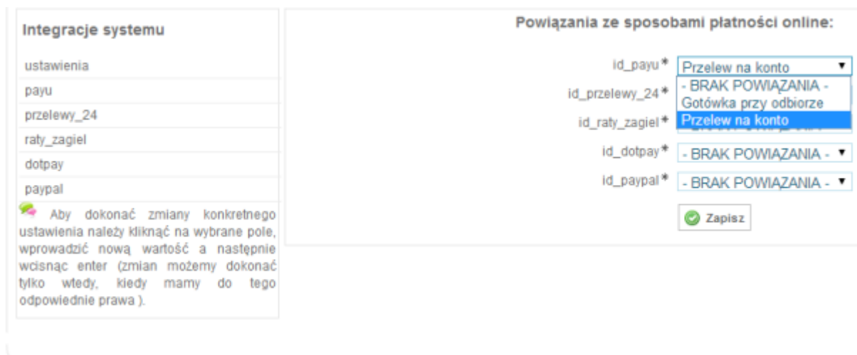
Ilustracja 4: Ustawienia powiązań płatności z systemem